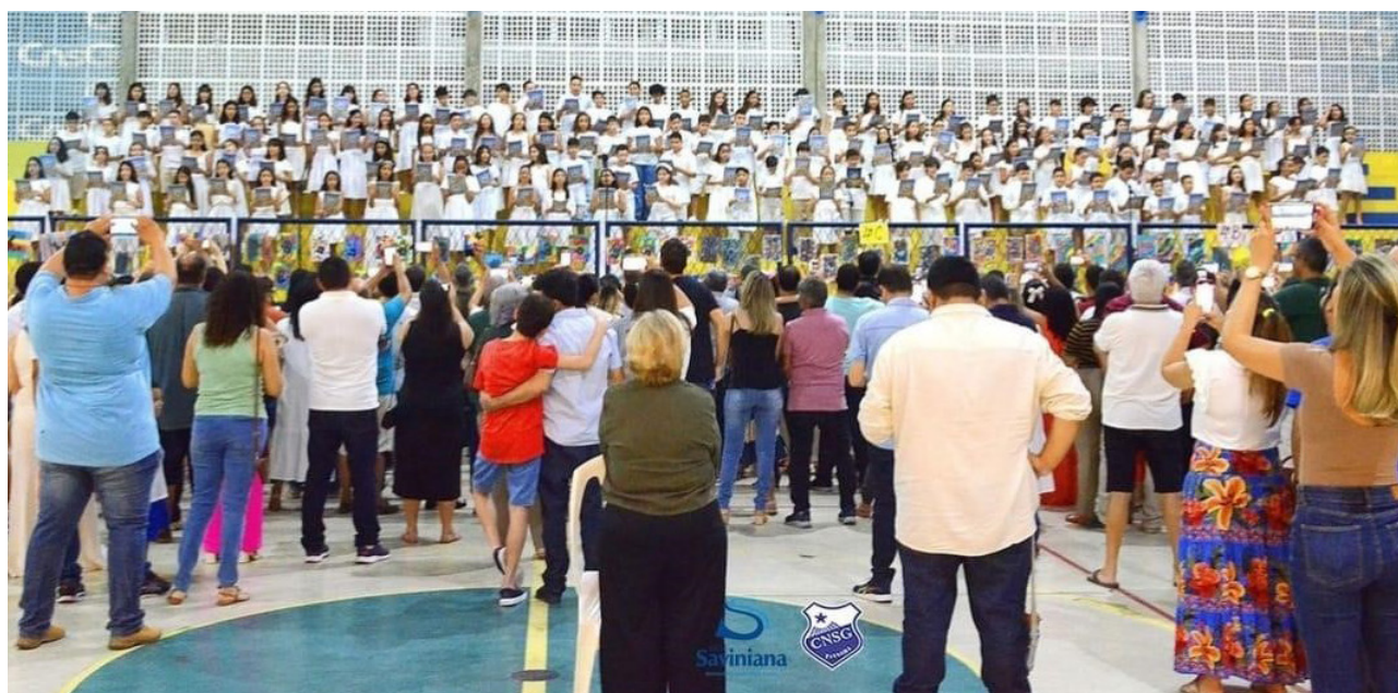
Figura 1: Apresentação dos 4º e 5º anos – “Natal das Emoções”

Nas turmas do 5º Ano, o tema foi “Briga e reconciliação”. As crianças puderam compreender a relação entre conflito e emoções e construir suas percepções sobre como estas interferem em seu meio. De posse desses conhecimentos, trabalharam as formas de administrar conflitos, conhecendo estratégias para a resolução dos mesmos.