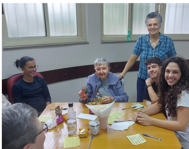
Figura 3: Residencial Hanami e Recanto Paz e Bem: instituições de longa permanência para idosos.