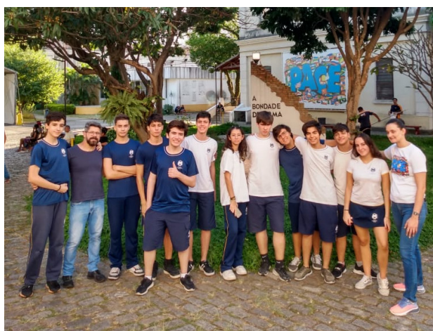
Figura 2: Grupo Voluntários do COMPA