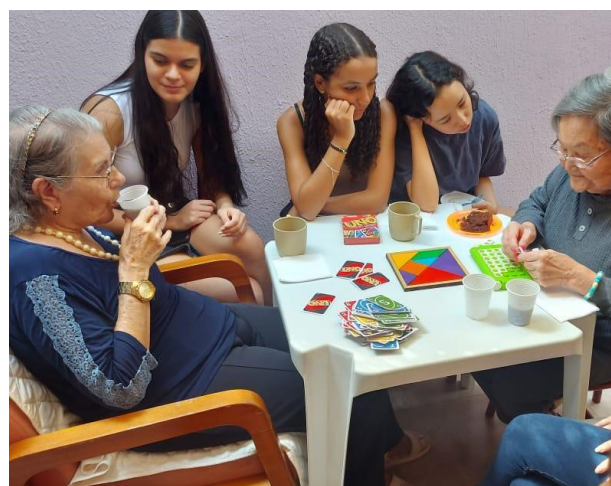
Figura 4: Residencial Hanami e Recanto Paz e Bem: instituições de longa permanência para idosos.