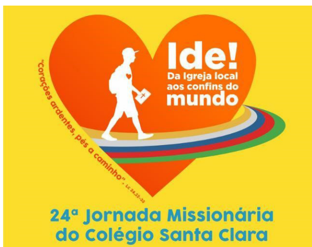
Figura 1: Logomarca da missão 2023