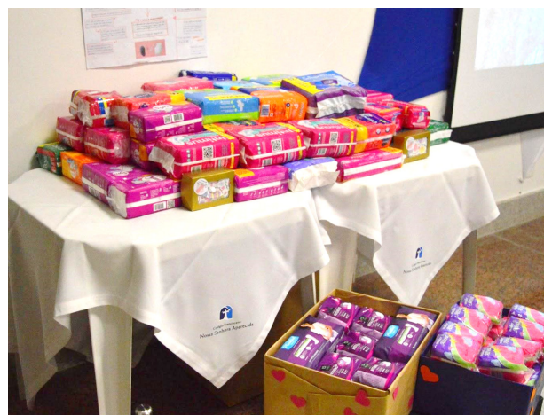
Figura 3: representa parte dos absorventes arrecadados com a campanha impulsionada pelos estudantes