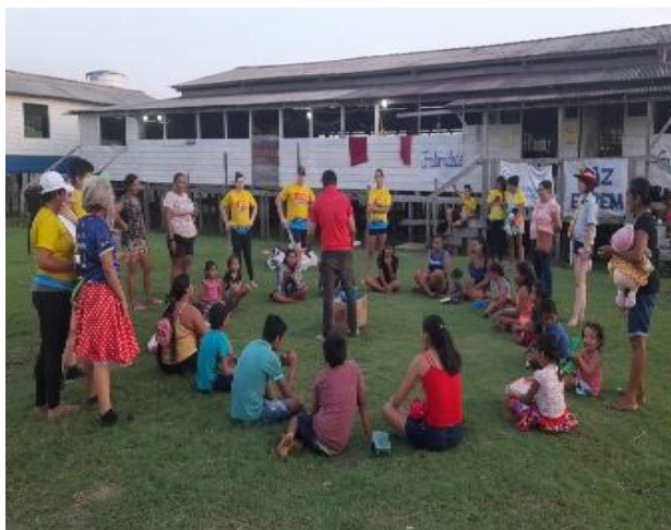
Figura 6: Contação de histórias infantis