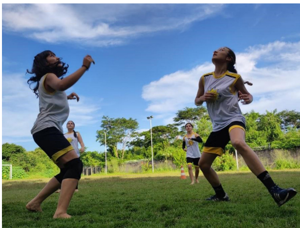
Figura 2: Atividade desportiva e esportiva – Modalidade Voleibol Feminino

Com foco na proteção integral de crianças e adolescentes, complementa o trabalho social das famílias dos seus atendidos, à medida em que acolhe e garante proteção social, por meio da identificação e do atendimento de suas demandas sociais, com vistas à promoção e ao alcance do protagonismo juvenil. Desse modo, dota meninas e meninos de aquisições que os tornam sujeitos sociais, políticos e transformadores de seu cotidiano.