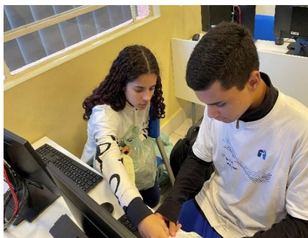
Figura 2: Estudantes da 1º Ano digitalizando notas fiscais