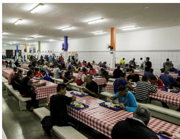
Figura 3: Preparação do refeitório nas instalações do Arsenal da Esperança. Jovens voluntários do Compa/2024