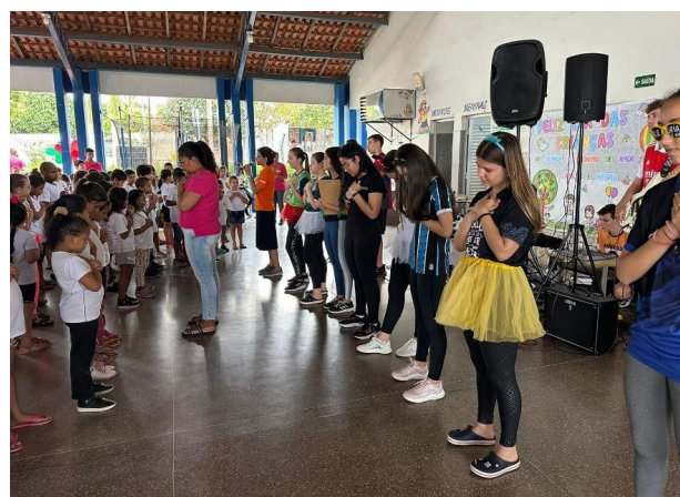
Figura 2: Grupo de alunos e banda da Pastoral em momento de oração - no ano de 2023

Para a concretização do projeto, nos três meses que antecedem a data