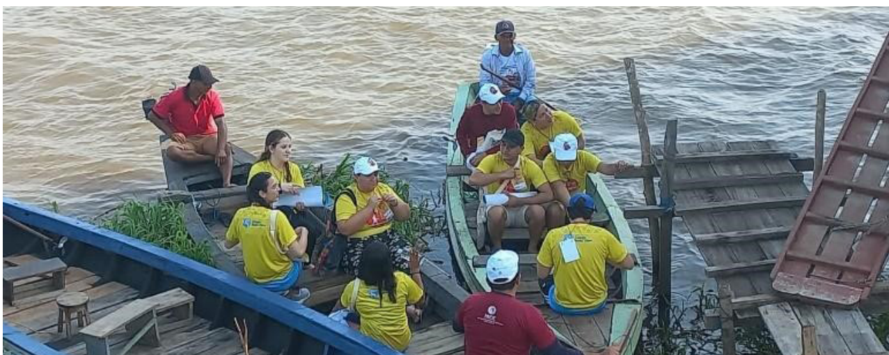
Figura 3: Travessia no rio para visitar os moradores mais distantes