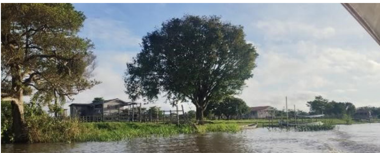
Figura 8: Região de várzea