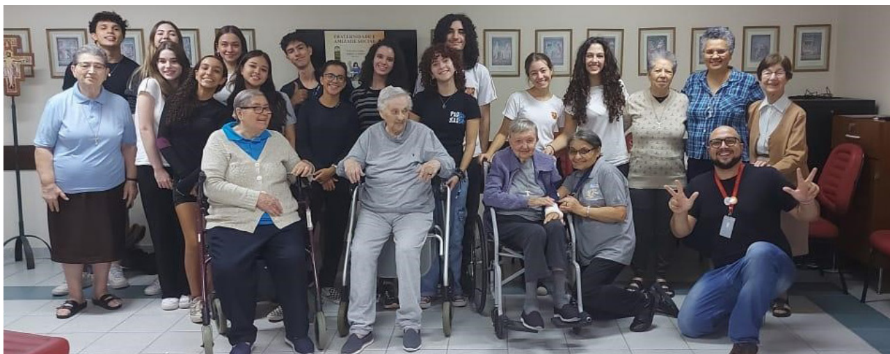
Figura 5: Residencial Hanami e Recanto Paz e Bem: instituições de longa permanência para idosos.