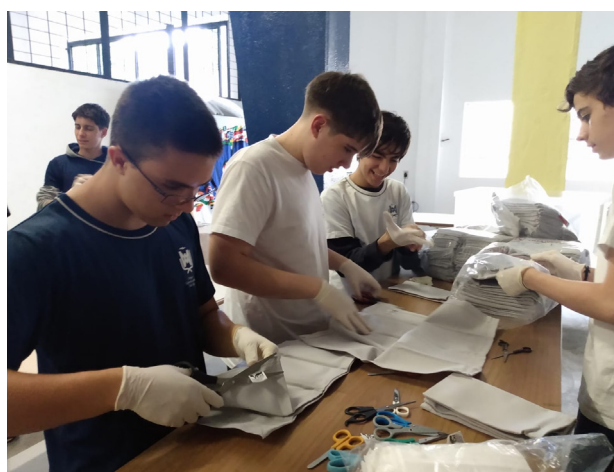
Figura 9: Recortando toalhas de rosto para os usuários do Arsenal