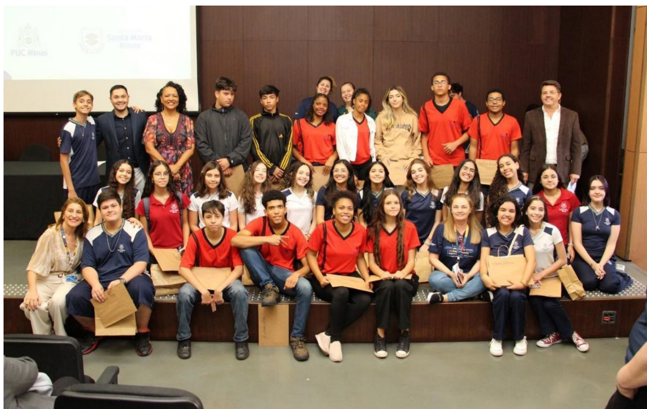
Figura 5: Alunos do Colégio Santa Maria Minas, unidade Cidade Nova, com os alunos da Escola Parceira, Escola Estadual Laudieme Vaz de Melo.