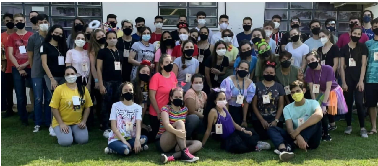
Figura 1: Equipe de trabalho com medidas de cuidados pós pandemia - ano de 2021

A primeira unidade escolar contemplada pelo projeto foi uma escola localizada na região leste do município, com um público que reside em bairros com vulnerabilidade social, obtendo resultados bastante positivos, “fazendo as crianças muito felizes”. Isso intensificou a vontade de repetir a atividade no próximo ano, repetindo os resultados positivos e enchendo o coração de todos de alegria, esperança e fraternidade. O projeto é realizado na semana das crianças, próximo ao dia 12 de outubro, envolvendo crianças de até 10 anos de idade, de regiões com vulnerabilidade social.