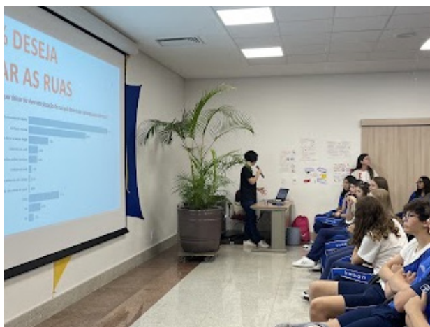
Figura 2: Culminância da sequência didática com o bate-papo sobre mulheres em situação de rua e pobreza menstrual