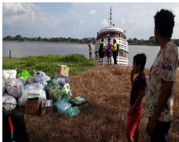
Figura 5: Chegada na primeira comunidade