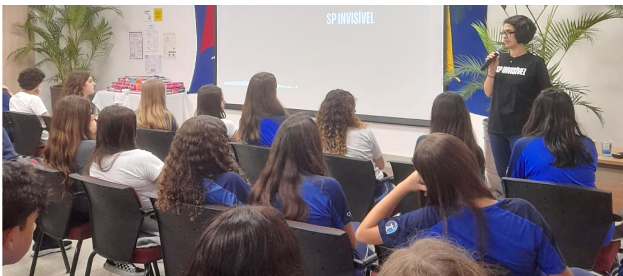
Figura 1: Culminância da sequência didática com o bate-papo sobre mulheres em situação de rua e pobreza menstrual