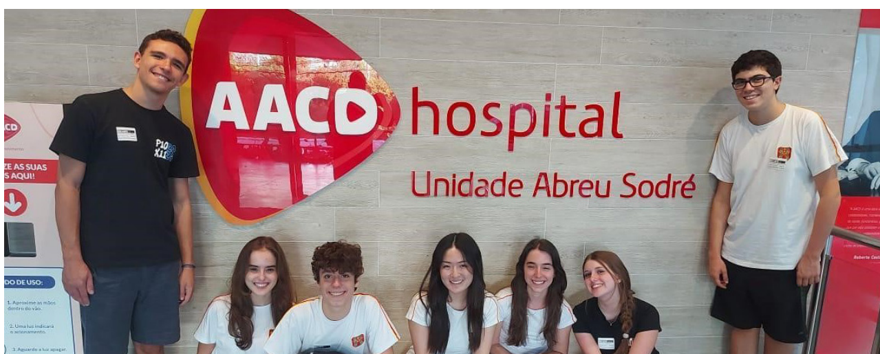
Figura 6: AACD: Hospital Especializado em Ortopedia e Reabilitação