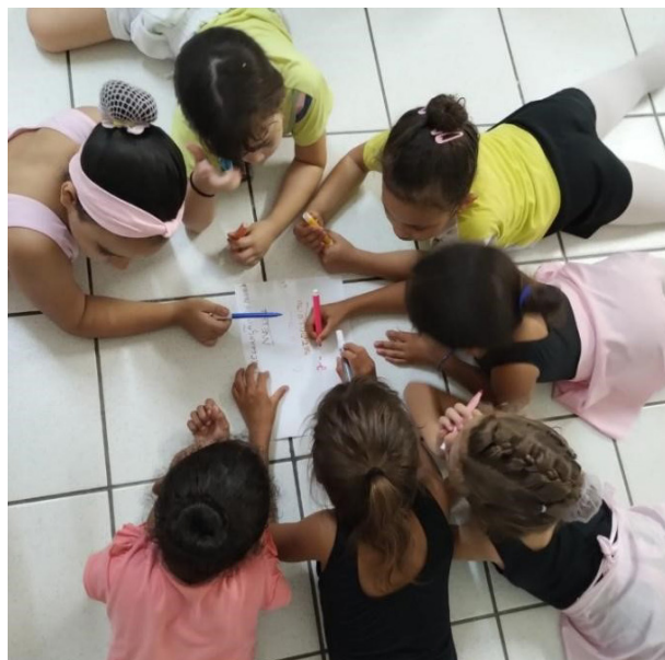
Figura 1: Atividade Socioeducativa. Tema: "Raios de Luz: meu lugar, nosso lugar". Modalidade Ballet infantil

O SCFV é organizado por faixas etárias, sendo crianças e adolescentes, de 6 a 15 anos, e adolescentes, de 15 a 17 anos, em uma perspectiva de prevenir possíveis situações de risco e, conseqüentemente, melhorar a qualidade de vida desses sujeitos. Dessa forma, em 2023 o Raios de Luz beneficiou 22 grupos de crianças