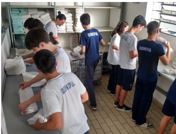
Figura 4: Dobrando roupas de cama e banho