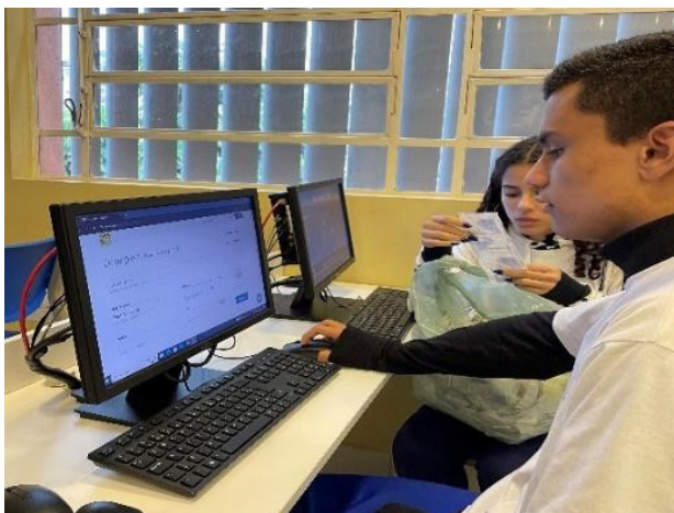
Figura 3: Estudantes inserindo os dados no portal da F.Julita