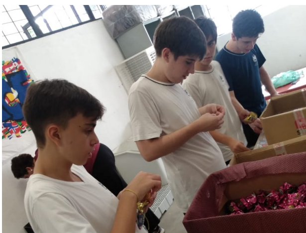
Figura 6: Montando kits de Páscoa, oferecidos aos moradores do Arsenal