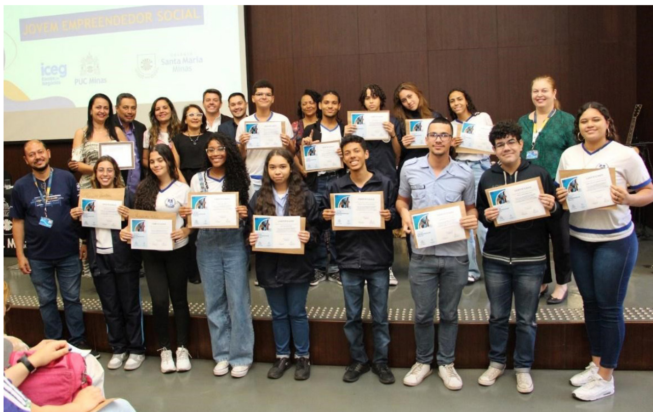
Figura 4: Alunos da Escola Estadual Padre José Maria de Man, de Contagem/ MG, recebendo o certificado de conclusão do curso “Jovem empreendedor social”