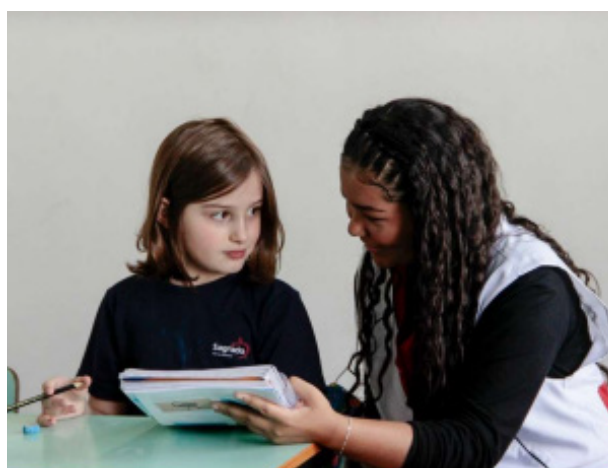
Figura 4: Estágio supervisionado