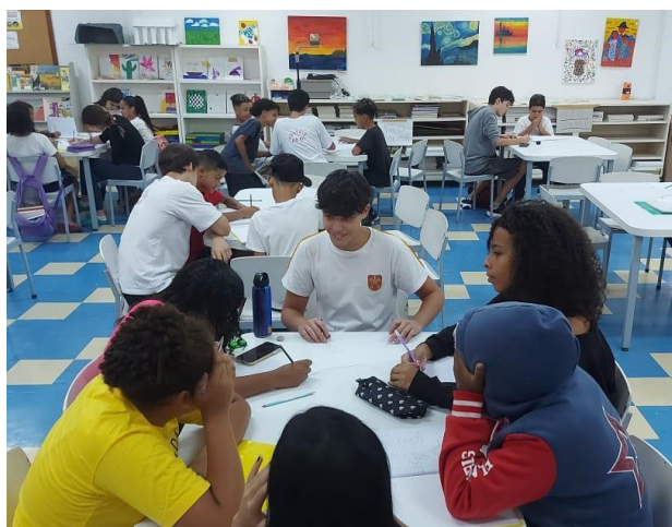
Figura 1: CCA São José de Paraisópolis: Centro de Proteção Social para Crianças e Adolescentes.

Algumas fotos dos projetos sociais e voluntariado: