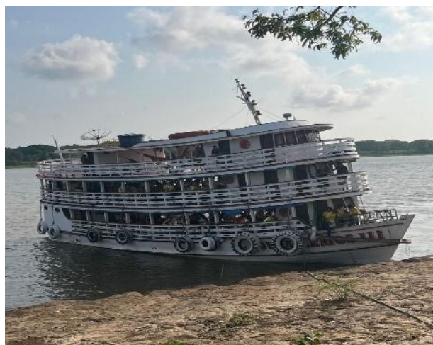
Figura 2: Transporte que conduziu os missionários