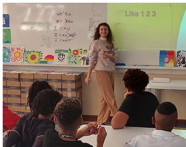
Figura 2: CCA São José de Paraisópolis: Centro de Proteção Social para Crianças e Adolescentes.