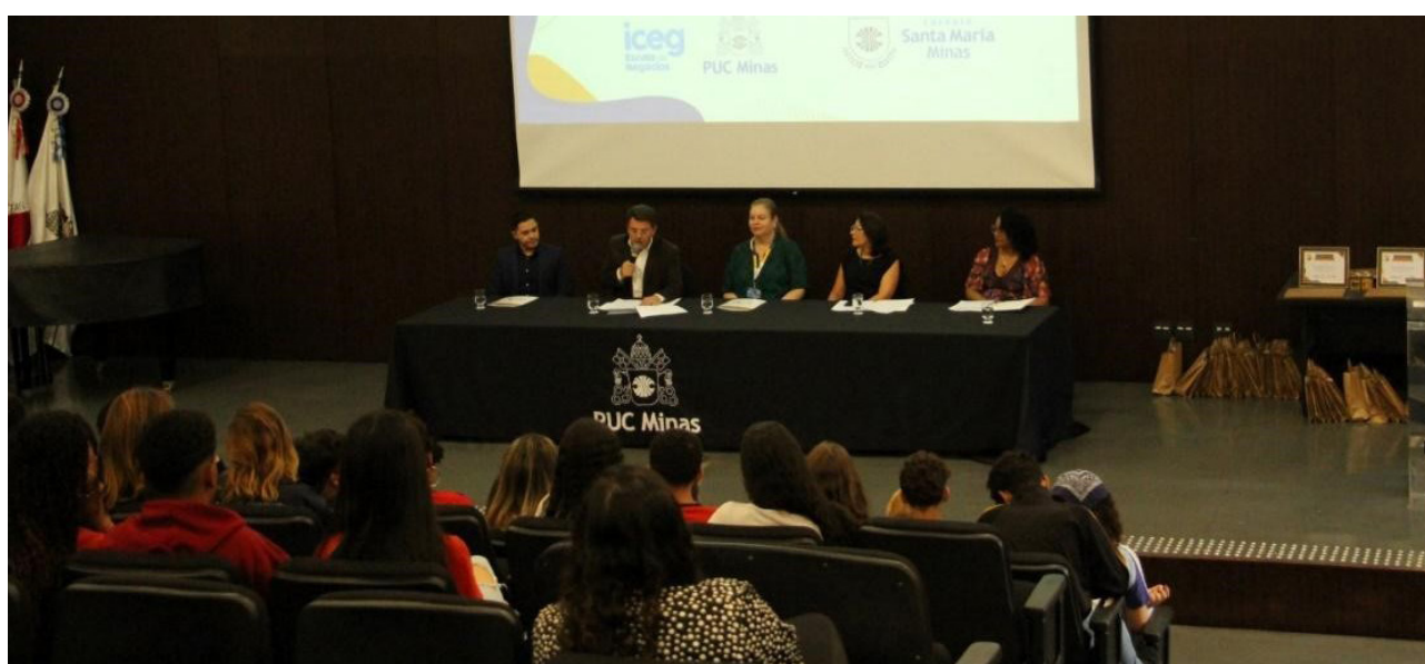
Figura 3: Cerimônia de entrega dos certificados e conclusão do curso – PUC Minas