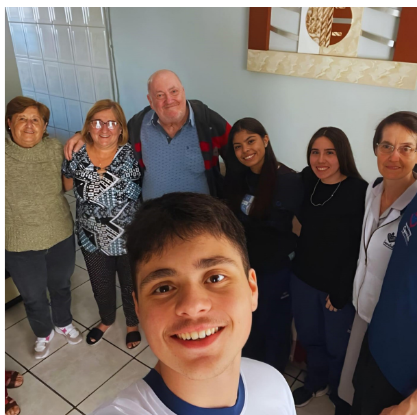
Figura 1 (Fonte: a autora)

A Pastoral Escolar pretende alcançar, no seu desenvolvimento, três dimensões: místico/ celebrativa, formativo/ integrativa e pastoral/ solidária, que são os projetos e atividades de intervenção concreta por meio de ações solidárias, como: campanhas, visitas, aulas, atividades dirigidas, entre outras. Diante disso, o Projeto Carinho, por meio das visitas, tem por objetivo desenvolver a sensibilidade do adolescente diante da realidade do próximo, aprendendo que, pelo acolhimento digno e verdadeiro, é possível transformar um pouco do que o outro vive, sendo que este outro é a imagem e semelhança do Mestre. As visitas acontecem no período vespertino, com os alunos sendo divididos em pequenos grupos e acompanhados pelos professores e pelas Irmãs da escola. Nas visitas, é possível encontrar diversas realidades, idosos doentes, alguns depressivos, outros solitários, uns mais felizes que outros.