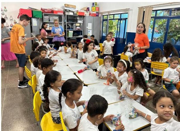
Figura 4: Oficinas de recreação com as crianças e jovens do Colégio Regina Coeli