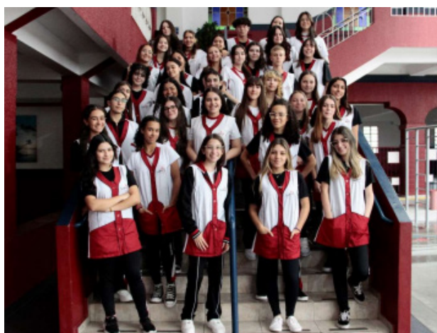
Figura 1: Turma do Curso de formação de docentes 2024