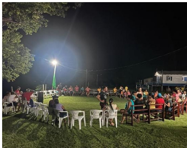
Figura 7: Noite cultural