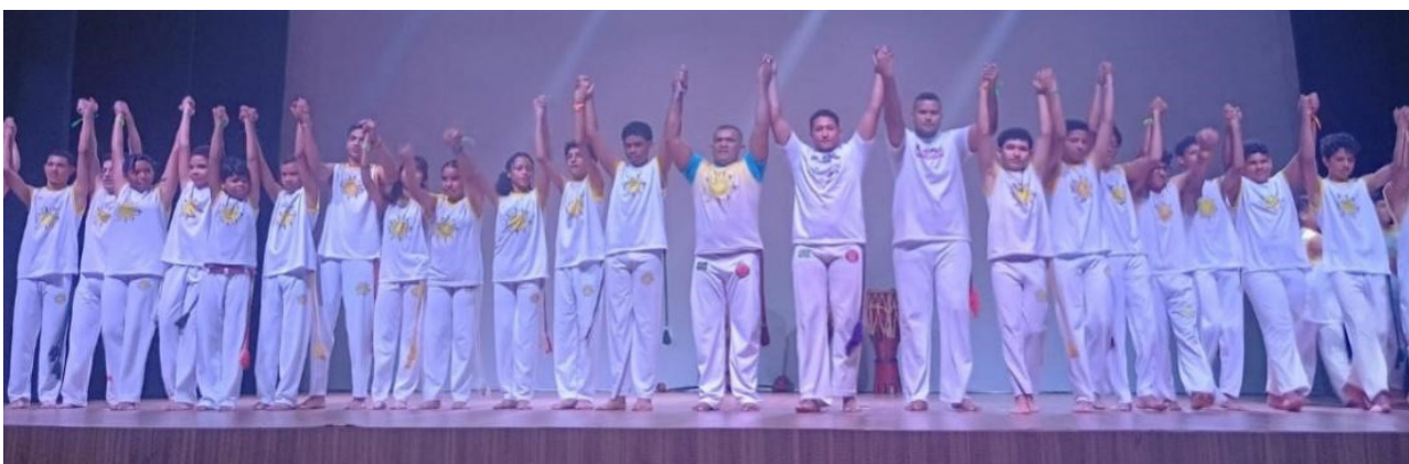
Figura 3: Atividade cultural - Capoeira

Neste contexto de formação cidadã, visando garantir o desenvolvimento de competências entre os beneficiários do serviço e promover o processo de autonomia, protagonismo, tomada de decisões, socialização e participação ativa na sociedade, são desenvolvidas no cotidiano semanal do Raios de Luz atividades socioeducativas. Essas atividades são planejadas, organizadas, avaliadas e flexíveis,