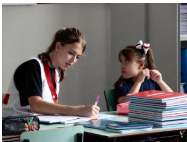
Figura 3: Estágio supervisionado