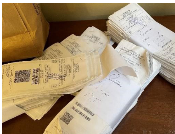
Figura 1: Notas fiscais a serem digitalizadas

A gente digitaliza notas com valores distintos, por vezes 7 reais, 20 ou 50... já tivemos também algumas de 200 ou 300 reais. Varia muito, mas acho que o trabalho é produtivo e vai ajudar muita gente. Estudante Guilherme Figueiredo, 1º ano.