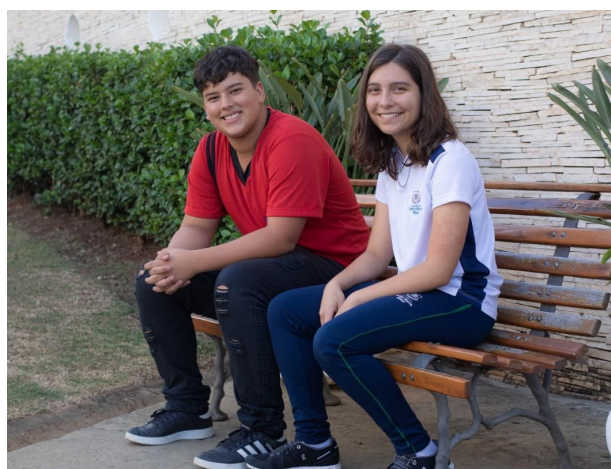
Figura 2: Aluno da Escola Estadual Laudime Vaz de Melo e aluna do Colégio Santa Maria Minas, em momento de interação e formulação dos projetos.