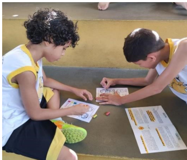
Figura 4: Atividade Socioeducativa. Tema: "Faça Bonito: conhecendo meu corpo e meus direitos". Modalidade Futsal Masculino.

Assim, com base na compreensão de proteção integral da criança e do adolescente, as ações executadas pelo SCFV Raios de Luz são planejadas. Isso permite que as crianças e adolescentes beneficiados semanalmente pelo serviço se apropriem dos espaços ofertados e, pelas ações conduzidas pelos educadores sociais e equipe técnica, possam refletir e exercitar suas escolhas, reconhecendo seus limites, possibilidades e potencialidades. Ou seja, o SCFV Raios de Luz proporciona uma formação para a participação e cidadania, incentivando o desenvolvimento do protagonismo e da autonomia dentre outros, considerando os interesses, demandas e potencialidades dessa faixa etária (BRASIL, 2013)