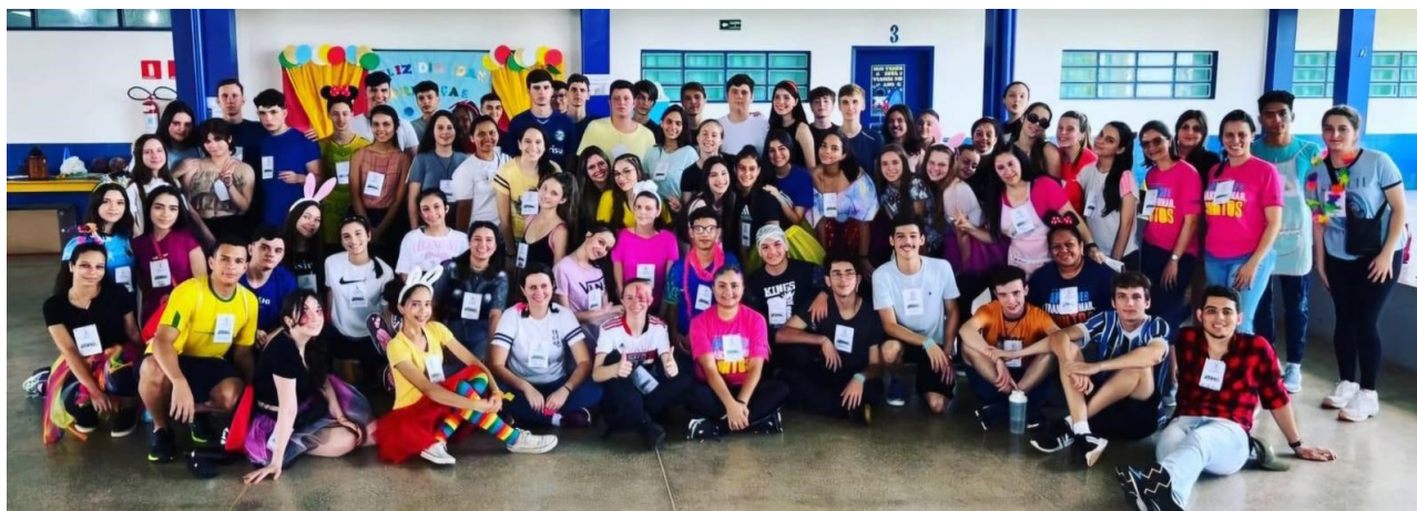
Figura 3: Equipe de trabalho no ano de 2022

agendada, os estudantes arrecadam mantimentos necessários para as atividades que são realizadas no dia da culminância do projeto, como ingredientes para cachorro-quente, suco, doces e brinquedos. No dia do evento, as crianças participam de orações (Figura 2), reflexões, brincadeiras diversas, pintura facial, músicas e danças, organizadas em estações, sempre supervisionadas pelos alunos do Ensino Médio.