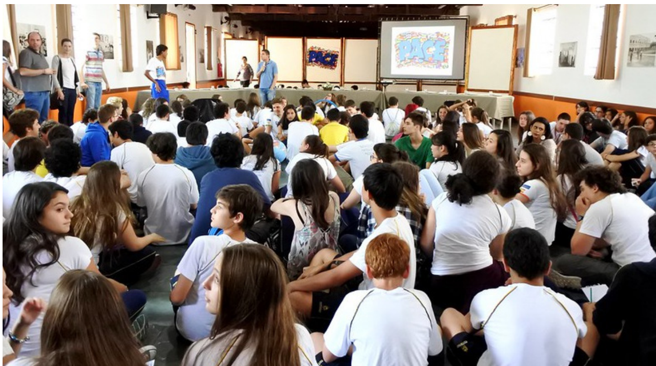
Figura 1: Momento formativo junto a outros jovens voluntários