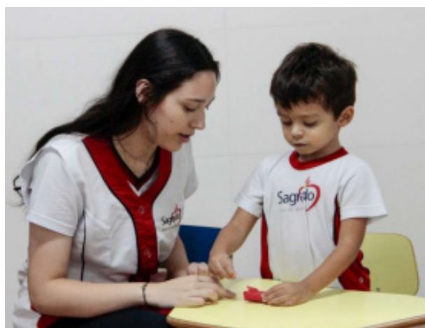
Figura 2: Estágio supervisionado