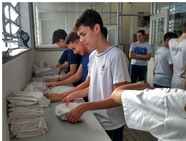
Figura 5: Organizando a rouparia