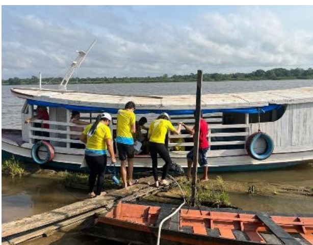
Figura 4: Ida dos missionários para visitar as casas mais distantes