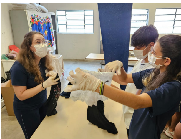
Figura 8: Organizando roupas para o bazar interno do Arsenal