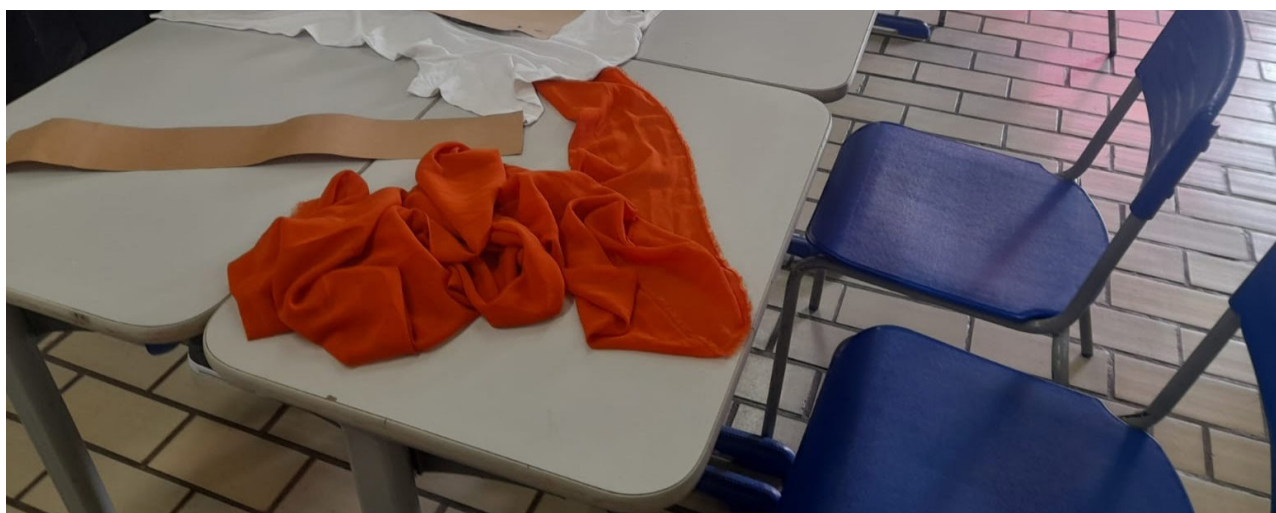
Figura 3