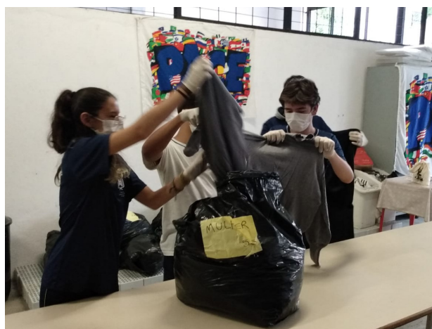
Figura 7: Organizando roupas para o bazar interno do Arsenal