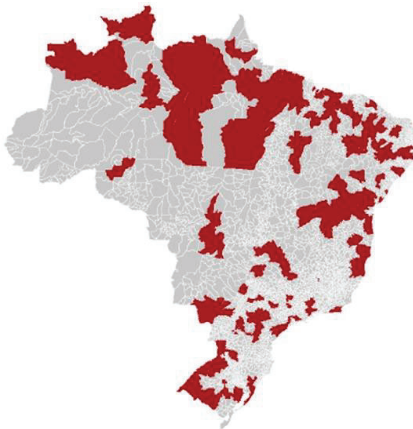
Mapa 1: Distribuição das regiões de saúde pelo território brasileiro (em vermelho)