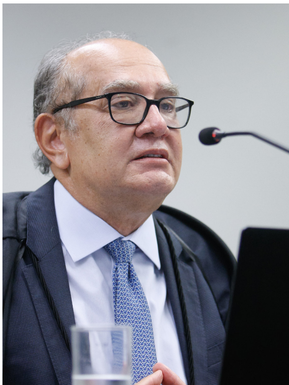
Ministro Gilmar Mendes

Diante desse quadro, podemos afirmar que a titulação pelo CEBAS tem apenas, caráter completo , não se constituindo em condicionante para a fruição do benefício constitucional da imunidade tributária das contribuições sociais. Tudo isso, em conformidade com o que determinou o próprio Supremo Tribunal Federal.