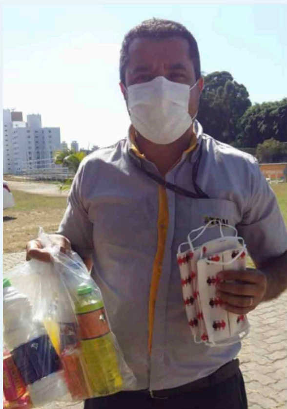
Pai de aluna do Projeto Meninas em Campo recebendo kits de higiene e máscaras doados pelos pais